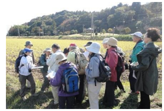
野外活動に於ける観察・解説活動

定点観察活動はセンター直下の湖岸(下図)において、水質や気象の変動など環境の変化が植物相に及ぼす影響を見るため、毎月第4水曜日を定例日に絶滅危惧種や特定外来生物など継続調査を指定した植物は年間を通して、又花や実冬芽など特徴のある植物についても適時に観察・記録して、その生態写真に説明を付してセンター展示室に掲示します。