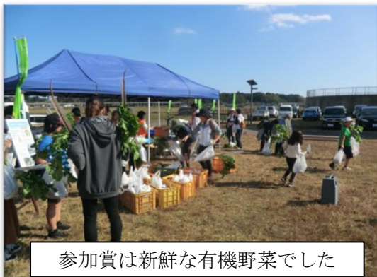
参加賞は新鮮な有機野菜でした

茨城県企業局提供の「鹿行の水」で喉を潤し、参加賞のさつま芋等を手にして、参加者の疲れも吹き飛んだようです。皆さん、お疲れ様でした。