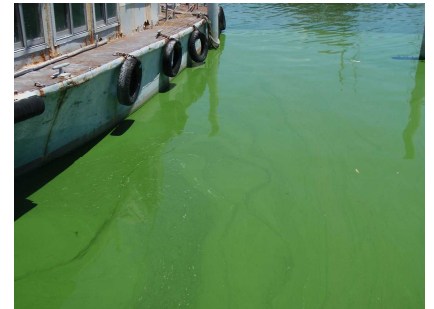
H24年度に土浦港で見られたアオコ