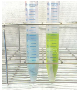
左:フィコシアニン 右:クロロフィル

アオコ情報では、アオコの現存量をフィコシアニン濃度で表しています。フィコシアニンとは、植物プランクトンの中でも藍藻類に含まれている青色の色素です。夏季の霞ヶ浦では、フィコシアニンの量は藍藻類の量と比例関係があります。ですから、フィコシアニンを測れば、アオコの原因となる藍藻類のおおよその量を把握できます。