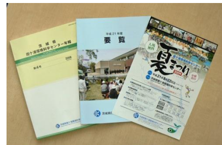
センター作成広報物