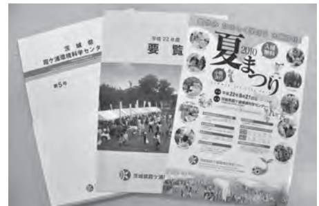
センター作成広報物