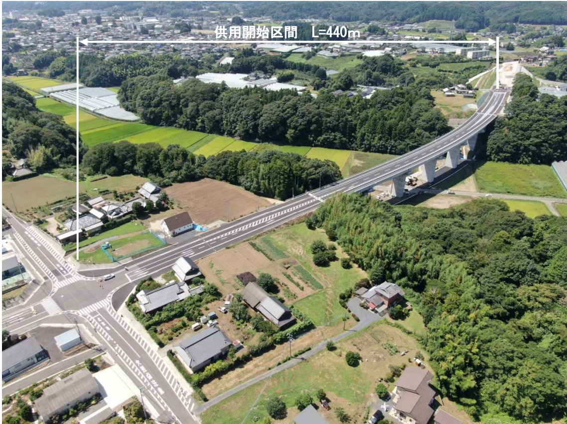
供用開始区間（常陸太田市瑞龍町～増井町地内）