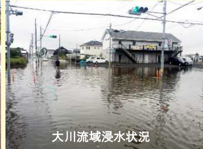
大川流域浸水状況