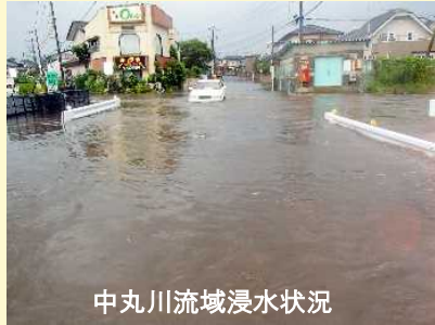
中丸川流域浸水状況