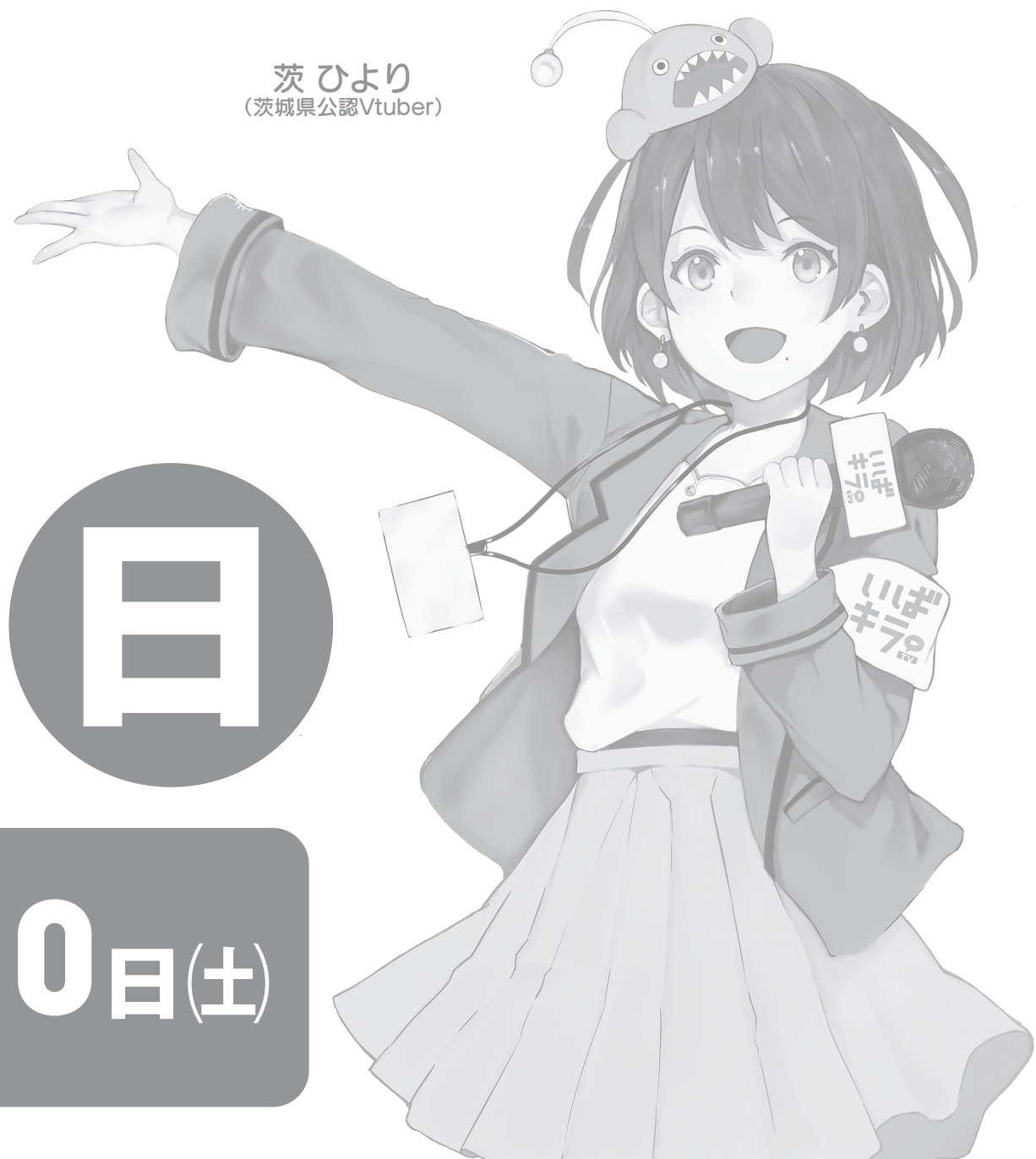
茨ひより (茨城県公認Vtuber)