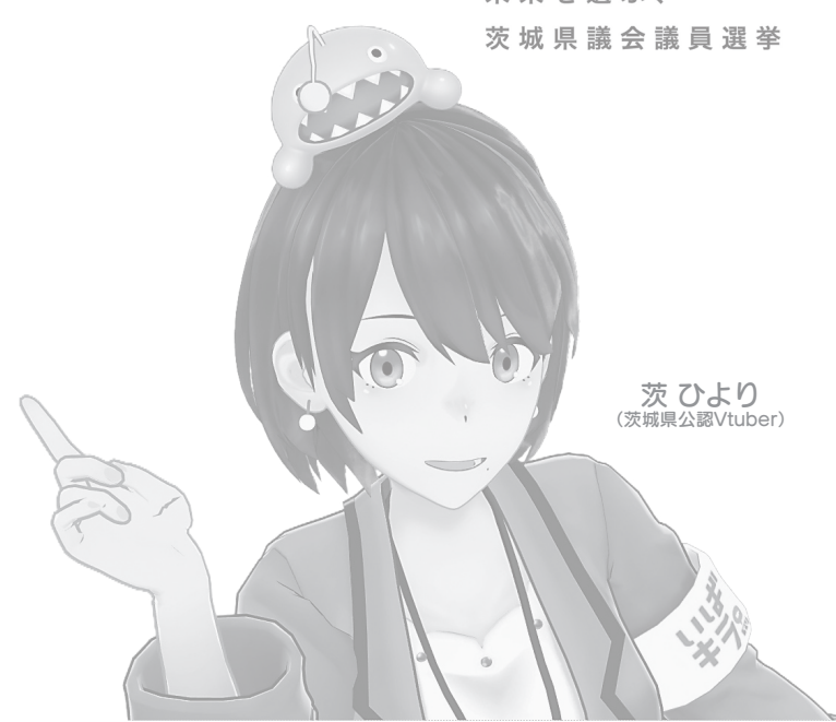
茨 ひより (茨城県公認Vtuber)

期日前投票期間 12月3日(土)~12月10日(土) (一部の期日前投票所を除く) 茨城県選挙管理委員会 検索