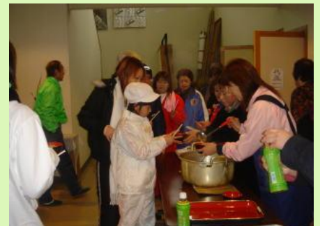
潮来市家庭排水浄化協議会で、豚汁を作ってくれました♪