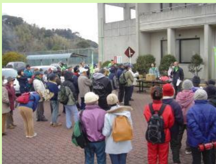
開会式 (潮来市大生原公民館)