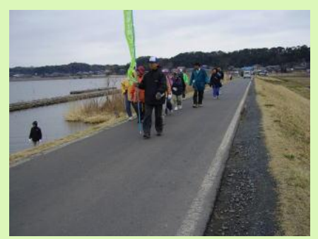
ウォーキングスタート!