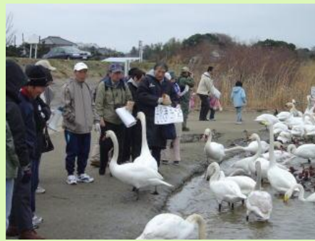
白鳥がすぐ側まで近づいてきました(水原白鳥飛来地)