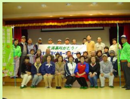
最後に、班ごとに記念撮影