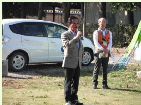
開会式(鹿嶋市長からもご挨拶いただきました)