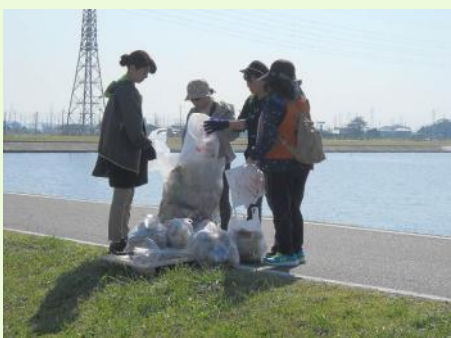
ゴミは70kgも回収することができました