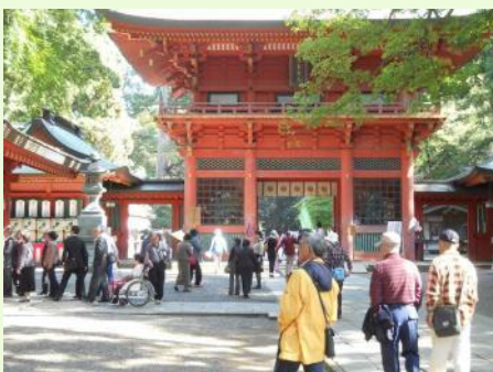
鹿島神宮内も散策し、歴史にも触れました