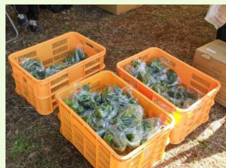
鹿嶋産の新鮮ピーマンを始め、参加賞を用意しました