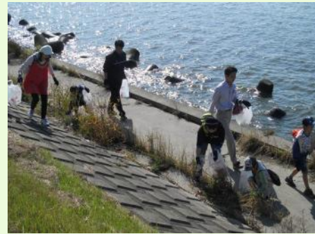
ごみを拾いながらウォーキング。天気は最高!