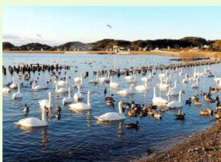
水原の白鳥飛来地には多くの野鳥