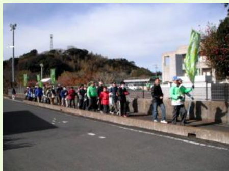
澄んだ空の下、ウォーキングスタート！