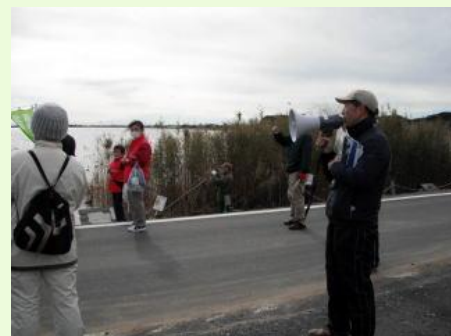
方波見先生の話は、野鳥の勉強になりました