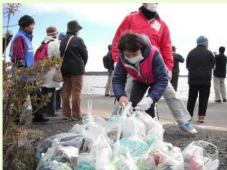
ゴミは思っていたよりもたくさん落ちていました