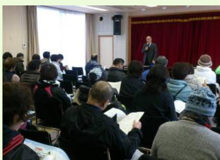
ミニ講座で浄化槽の勉強(潮来市大生原公民館)