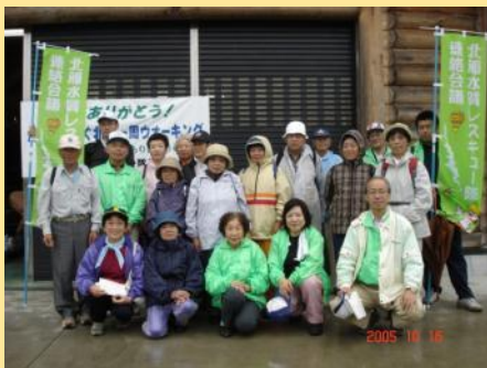
出発前、班ごとに記念撮影（エコハウス前）