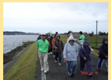
雨が降ったり止んだりの天気でした