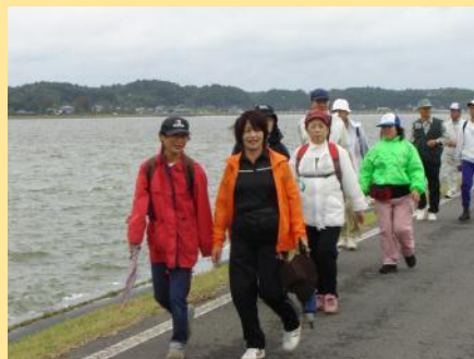
バスで移動し、ウォーキングスタート！