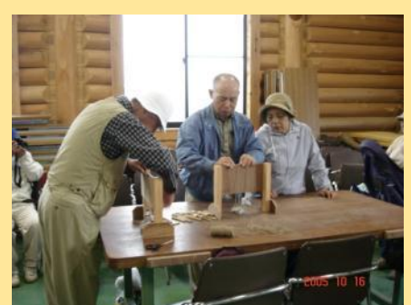
そしてヨシ細工について教えていただきました♪