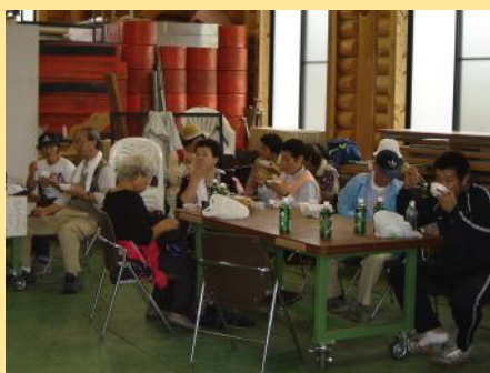
ゴール後には暖かい豚汁をみなさんでいただきました