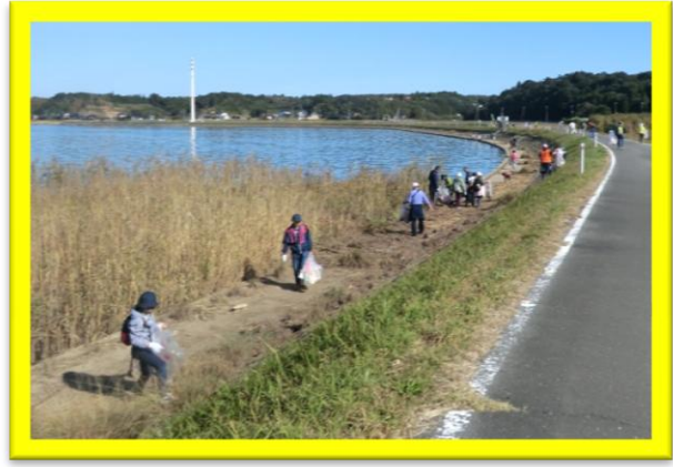
湖岸にはゴミが沢山ありました