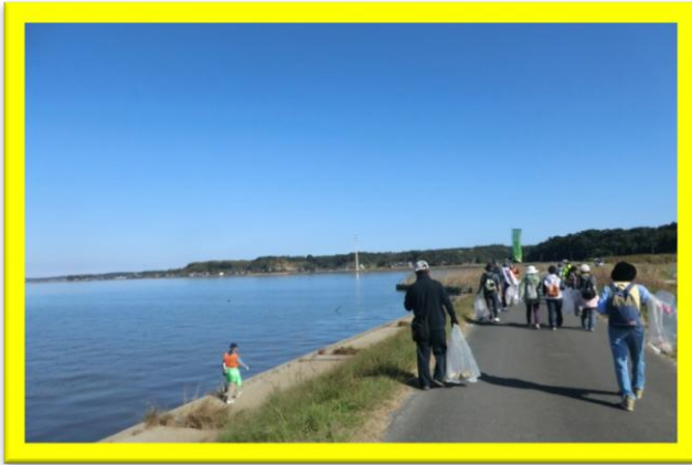
北浦を眺めながらウォーキング