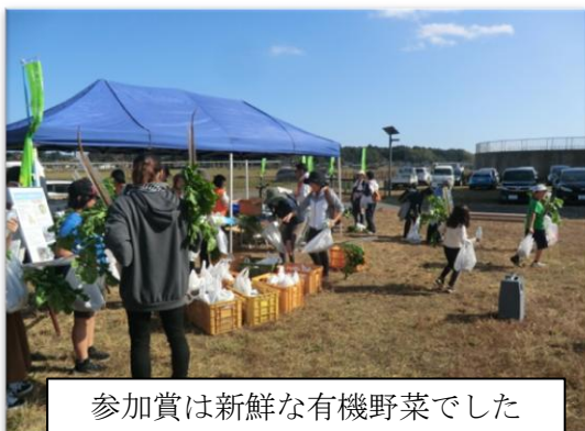
参加賞は新鮮な有機野菜でした

茨城県企業局提供の「鹿行の水」で喉を潤し、参加賞のさつま芋等を手にして、参加者の疲れも吹き飛んだようです。皆さん、お疲れ様でした。