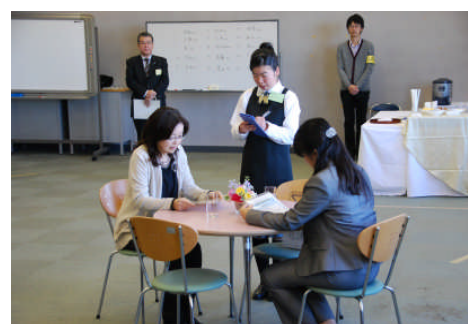
喫茶サービス競技