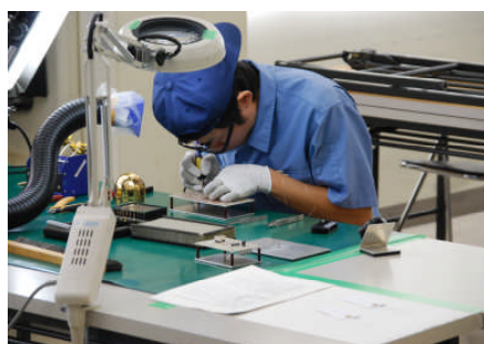
電子機器組立競技

【お問い合わせ】茨城県商工労働部職業能力開発課 (TEL: 029-301-3656)