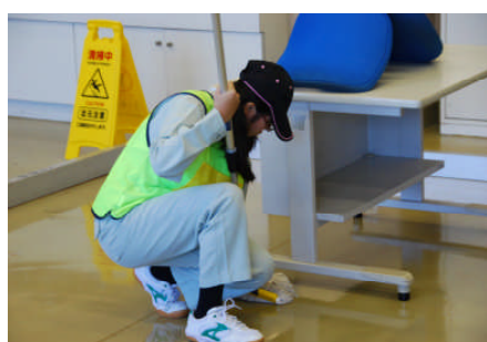
ビルクリーニング競技