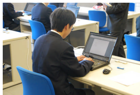
ワード・プロセッサ競技