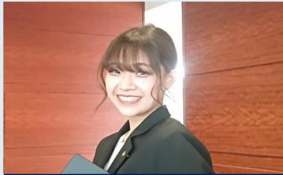
※各部署20代30代活躍中！