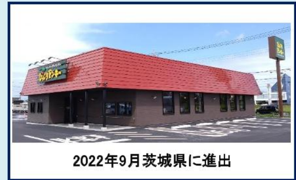
2022年9月茨城県に進出