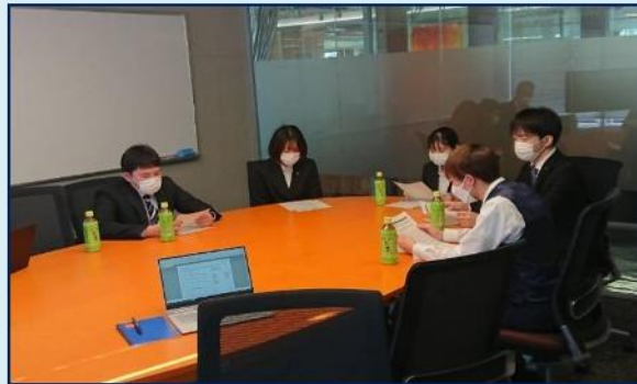
※新入社員研修 (関東オフィス)