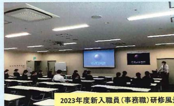
2023年度新入職員(事務職)研修風景

＜採用担当者からのメッセージ＞ ご覧いただきありがとうございます。 病院事務の求人です。 チーム医療の一員としての役割は大きく、やりがいのある仕事です。 資格は必要ありません。 一度病院見学にいらっやいませんか？