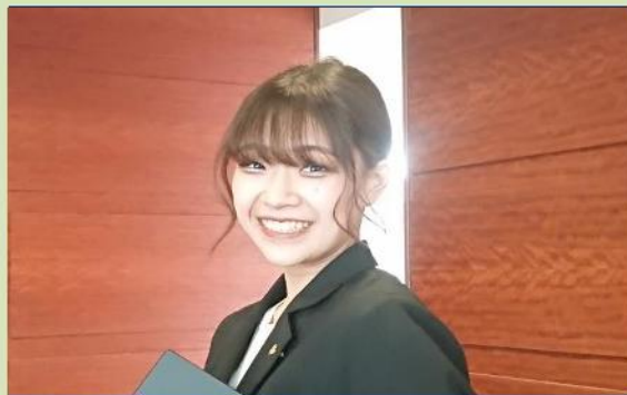
※各部署20代30代活躍中！