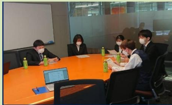
※新入社員研修(関東オフィス)