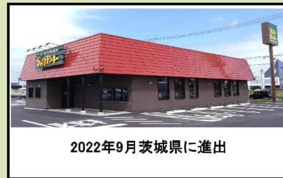
2022年9月茨城県に進出