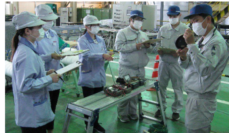
新入社員現場実習風景