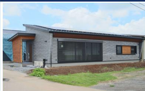
自社モデルハウス外観

パッシブハウス認定住宅の実績(世界基準)、住宅コンクール入賞、マスコミ掲載多数あり