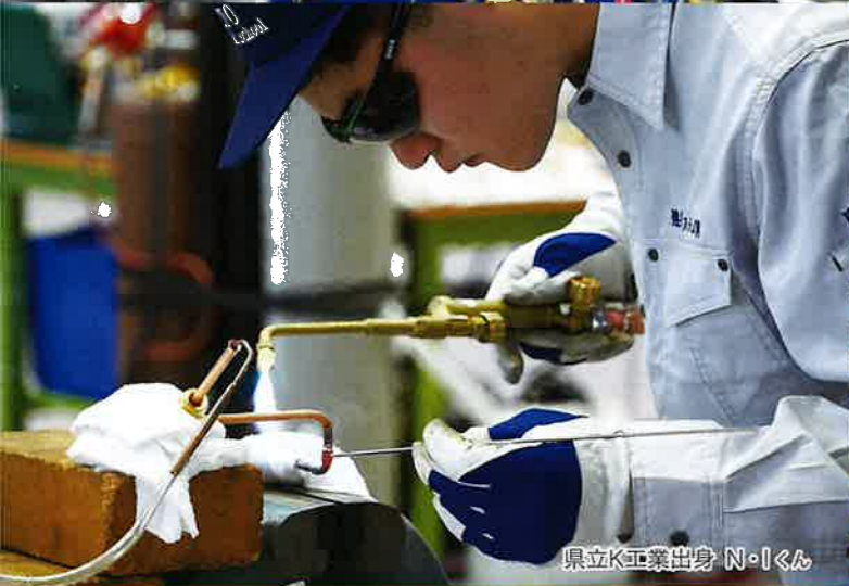
県立K工業出身 N・Iくん