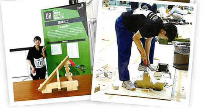
技能五輪 & 若年者ものづくり