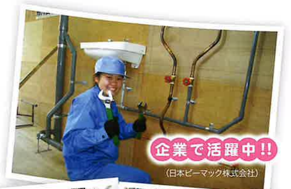
企業で活躍中!! (日本ビーマック株式会社)