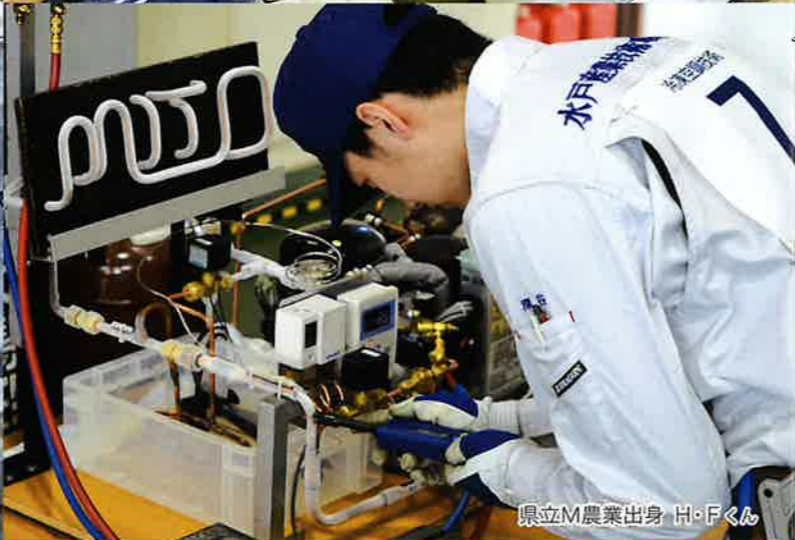
県立M農業出身 H・Fくん