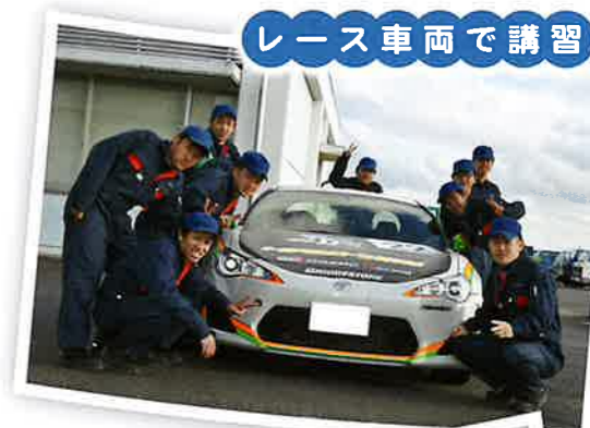
レース車両で講習