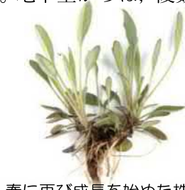
春に再び成長を始めた株