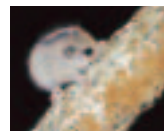
ヤマネ(絶滅危惧種)