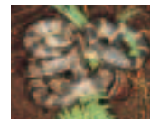
シロマダラ(希少種)