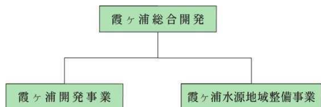
図2 霞ヶ浦総合開発の体系

( https://www.mlit.go.jp/mizukokudo/mizsei/mizukokudo_mizsei_tk2_000005.html )