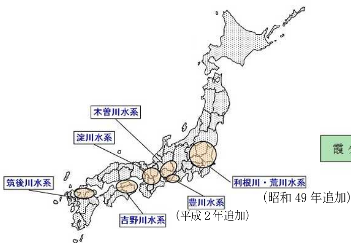
図1 水資源開発基本計画水系位置図

※1 利根川、木曾川、淀川、吉野川、筑後川の5つの水系。 その後、荒川(昭和49年)、豊川(平成2年)が追加された。 この全てにおいて水資源開発基本計画を定めています。(なお、利根川及び荒川に限り、2水系を合わせて1つの水資源開発基本計画としています。)