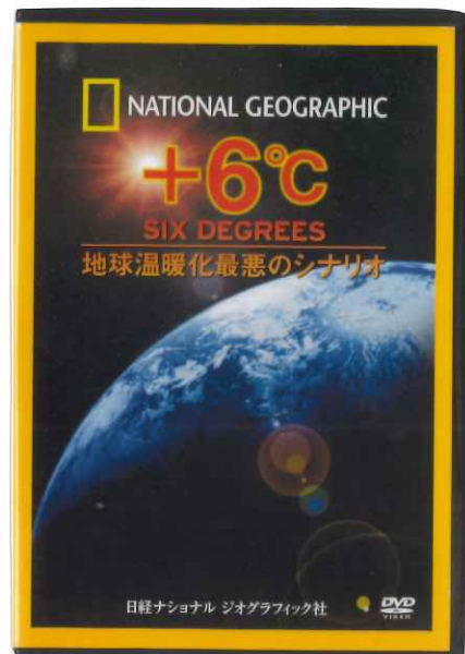
+6°C SIX DEGREES 地球温暖化最悪のシナリオ

中学生から大人向け 収録時間 1時間35分 制作 2008年 日経ナショナル ジオグラフィック社 地球の気温は2100年までに6度上昇するといわれ、待ったなしの状況である地球温暖化問題。気温が1度上昇するごとに起こりうる事態を予測。実際の映像とCGで描かれた衝撃の世界を映し出しています。 ○干ばつ、森林火災が頻発し、砂漠化が進行 ○サンゴが死滅し、極地と高地の氷河が消失 ○巨大嵐が各地を襲い、沿岸の大都市は水没