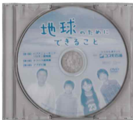
地球のためにできること

小学生向け 収録時間 38分 制作 2005年 ココロも満タンにコスモ石油 私たちが住んでいる地球。実はさまざまな環境問題の影響で、困っている人たちがいます。みんなですっと地球で暮らすために、地球のために何ができるのか、一緒に考える教材です。 第1部 パプアニューギニア・ソロモン諸島 第2部 キリバス諸島 第3部 アブダビ