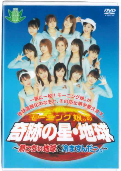
モーニング娘。の奇跡の星・地球 ～熱っつい地球を冷ますんだっ。～

子どもから大人向け 収録時間 58分 制作 2004年 NHKエンタープライズ21 協力 環境省 第1の謎 地球が熱くなるとどうなるの？ 第2の謎 なぜ地球が熱くなるの？ 第3の謎 地球を冷ますにはどうしたらいいの？ ○三つの謎を解き明かす過程で、モーニング娘。のメンバーが話しあったり現場レポートに出かけたりと大活躍します。