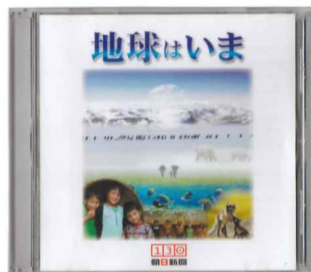
地球はいま いのちの星に生きる

小学生向け 収録時間 約1時間20分 制作 2008年 朝日新聞地球環境プロジェクト いま地球で何が起きているのか、なぜ温暖化が起きているのかを知り、美しい地球を守るために何ができるか、一緒に考える教材です。 ①グリーンランド②スバルバル諸島③アラスカ ④北極海⑤シベリア⑥沖縄⑦南太平洋諸島 ⑧オーストラリア⑨インドネシア⑩ブラジル ⑪ヒマラヤ⑫バングラデシュ⑬アフリカ