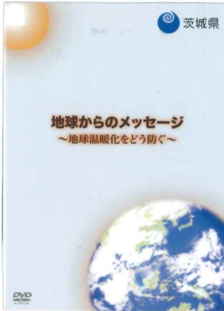
地球からのメッセージ ～地球温暖化をどう防ぐ～

中学生向け 収録時間 30分 企画・著作 茨城県 制作 2010年 NHKエンタープライズ 映像のなかで紹介されている予測は、想定したシナリオに基づき、地球シミュレーターにより、計算されたもので、将来を予言するものではありません。 茨城県内の中学校での地球温暖化に対する、実際の取組が紹介されています。 未来を想像して、この豊かな地球を守るために、今私たちは何をすればよいのか、一緒に考える教材です。