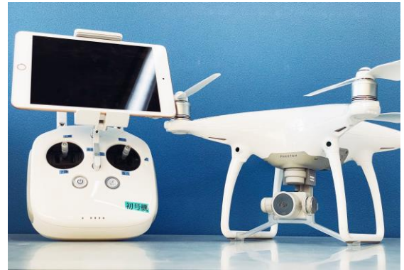
▲研修で使用するドローン

※ 河川敷での飛行研修にのみお越しの場合、下記お問い合わせ先まで事前にご連絡いただきますようお願いいたします。