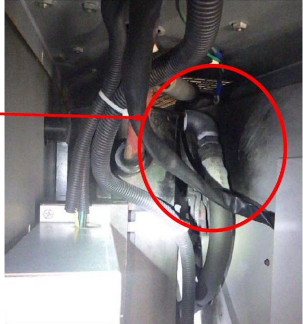
空気圧縮機内部（上部から見たところ）

空気圧縮機 寸法 cm：約 200(幅) × 約 150(高さ) × 約 73(奥行き)