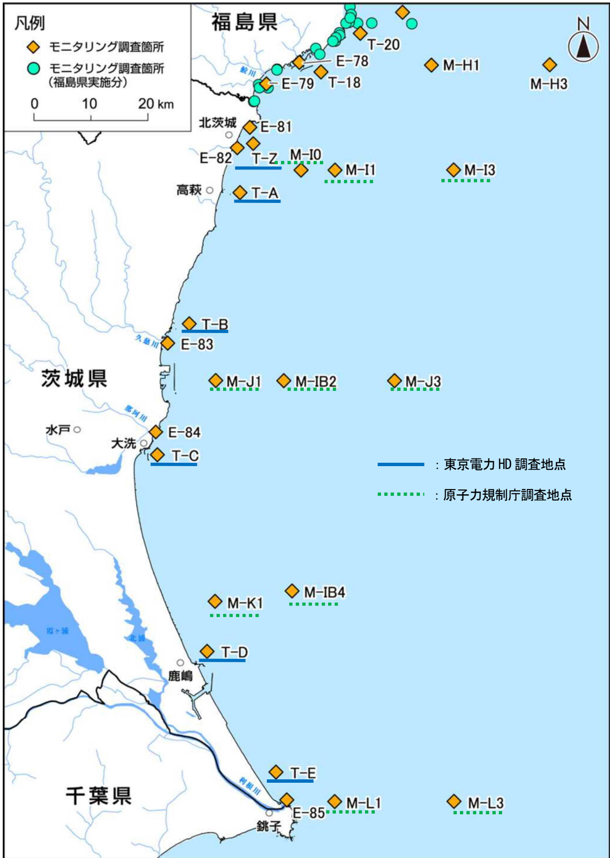
図Ⅱ-2 茨城県沖合の海域モニタリング地点 (海域モニタリングの進め方)