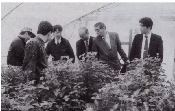
平成 7 年 おおばの現地調査の様子

県においては、農業産出額の全国第 2 位奪還のため、平成 15 年度より茨城農業改革を開始、消費者のベストパートナーとなる茨城農業の確立を目指すことになった。研究会としても、それに則して活動をシフトして行くこととなる。