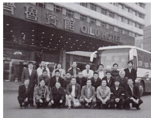
平成 13 年 中国野菜の生産