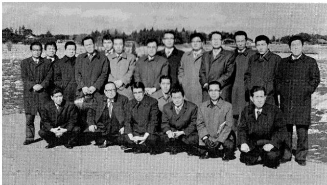
昭和53年 貯蔵はくさい現地研修の様子

本研究会も茨城県産野菜のシンクタンク集団として、銘柄産地づくりをバックアップする活動を展開するため、昭和57年に果菜・葉茎菜・根菜、昭和58年に洋菜・促成の各部会を設けるなど、銘柄産地に向けて濃密な産地指導が出来る体制を整備し、部会を中心として主要な品目の課題解決にあたった。