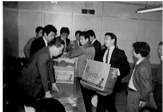
昭和62年 はくさい品質規格検討会の様子