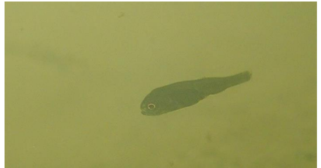
写真3 水中での様子

令和2年5月29日に、久慈川でコクチバスの仔魚(しぎょ)を確認しました。当試験場では、全長約16cmの若い個体を確認していますが(内水面支場News!「久慈川でコクチバスを採集・確認」平成29年10月31日)、今回新たにふ化後数日しか経っていないサイズ(全長約1cm)の仔魚が確認されたことから、残念ながら久慈川でコクチバスが繁殖していると考えられます。