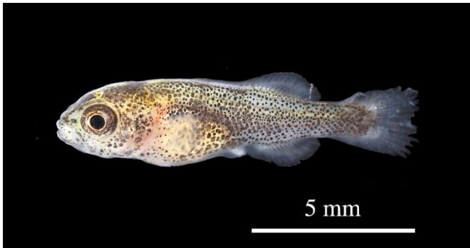
写真1 採集されたコクチバス仔魚