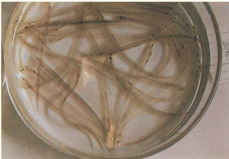
図版 水温別変態期間の推定 群試験終了時のマアナゴ幼魚 上から20℃区, 16℃区, 止水区