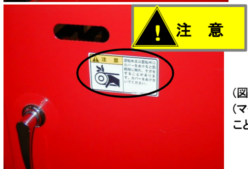
(図2) 自脱型コンバインの手こぎ部分付近のマーク (マークには「定置脱こくをするときは、チェーン等に十分注意して作業してください。服のそでや手が巻き込まれてケガをするおそれがあります。」と記述。)

注意事項を守らなかった場合、軽傷または中程度の障害を負う可能性がある危険状況を示しています。