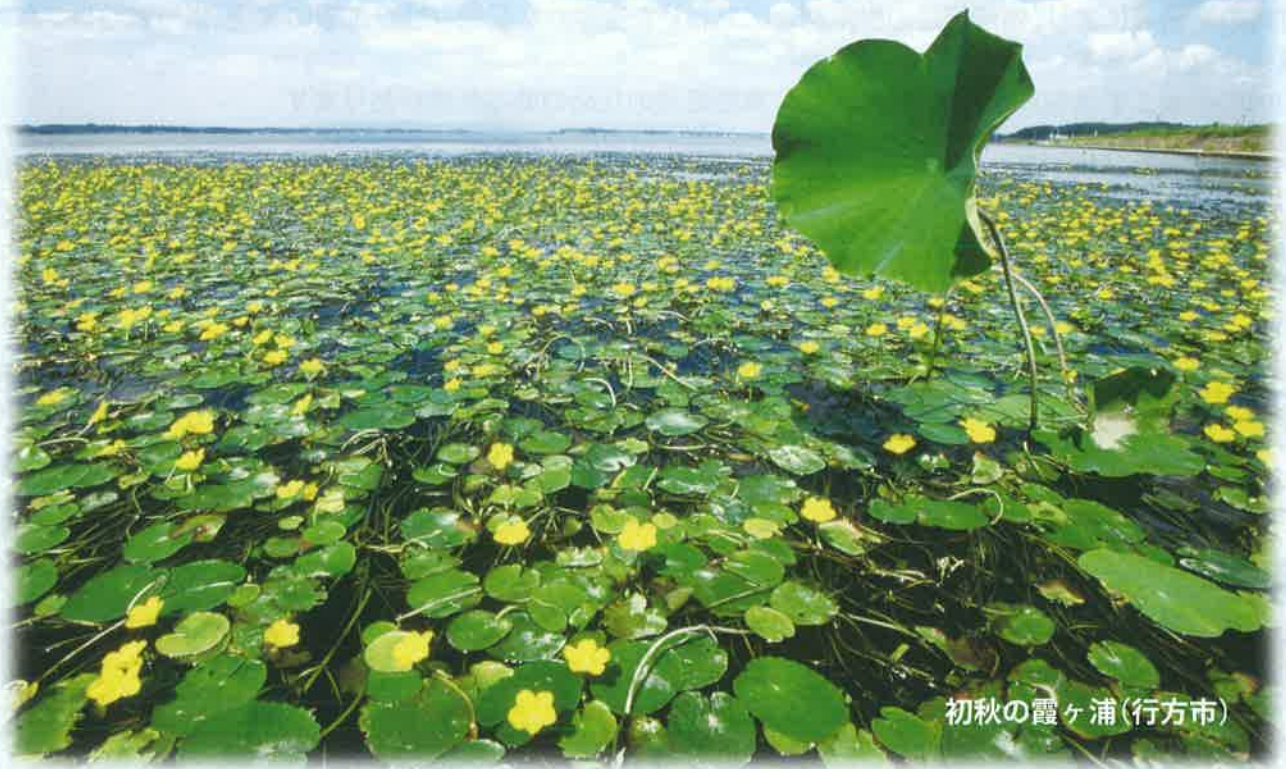
初秋の霞ヶ浦(行方市)