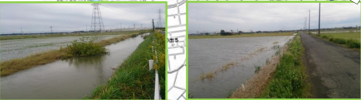
平成25年10月13日 台風26号による湛水状況

排水路を改修することにより、地下水位を低下させ、耕地の汎用化による営農の安定化を図る。