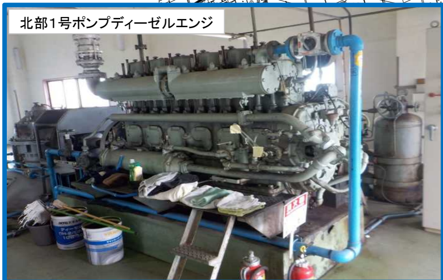
北部1号ポンプディーゼルエンジ