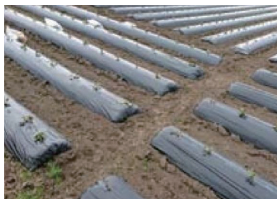
枕畝途中に設置した排水路