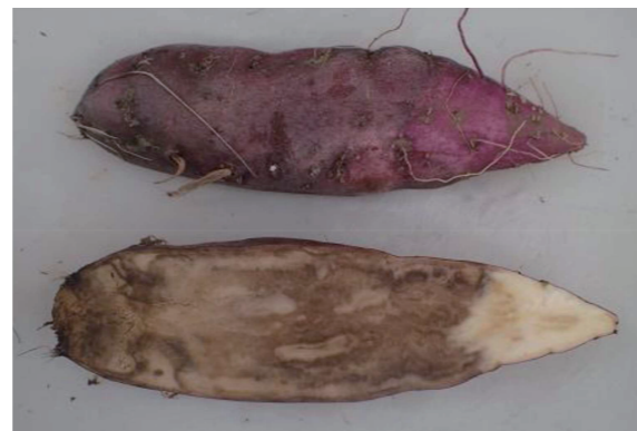
なり首側からの塊根腐敗