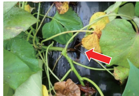
株の基部の変色(暗褐色～黒色)