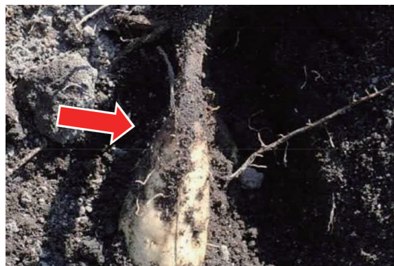
黒変がなり蔓から塊根へ到達