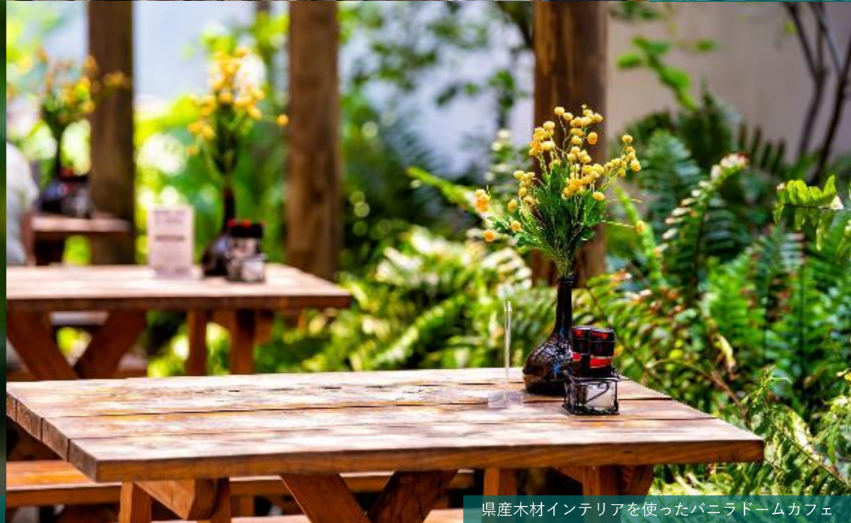
県産木材インテリアを使ったバニラドームカフェ