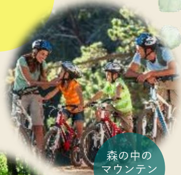
森の中の マウンテン バイク