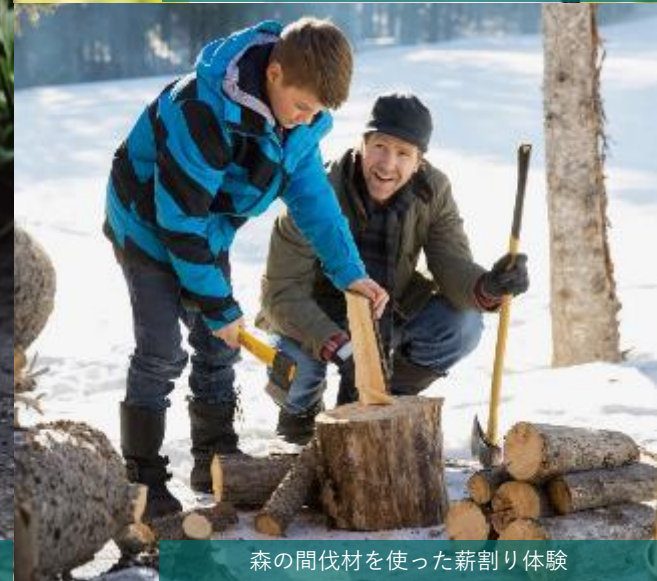
森の間伐材を使った薪割り体験