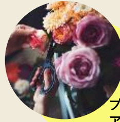
プリザーブド&ドライフラワー アレンジメント教室