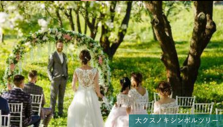
大クスノキシンボルツリー