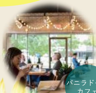
バニラドーム カフェ