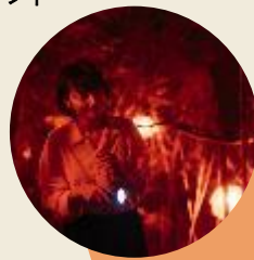
光と映像のナイトアドベンチャー ※参考事例：長崎・伊王島