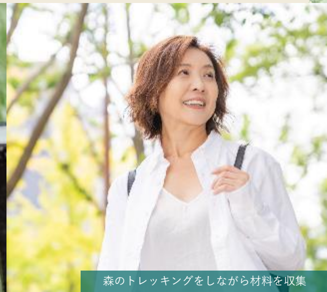
森のトレッキングをしながら材料を収集