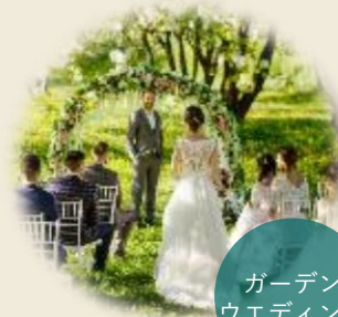
ガーデン ウエディング