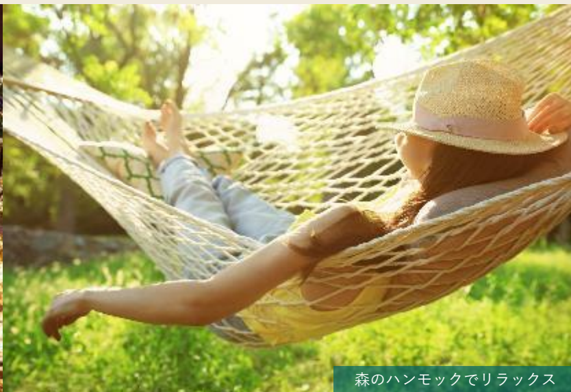
森のハンモックでリラックス