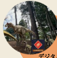
デジタルを利用した森林体験 ※参考事例：ハウステンボス KDDI「恐竜シューティング」 (該当施設関連サイトから引用)