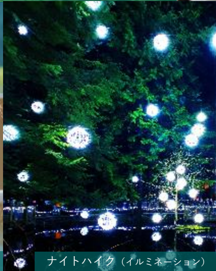
ナイトハイク (イルミネーション)