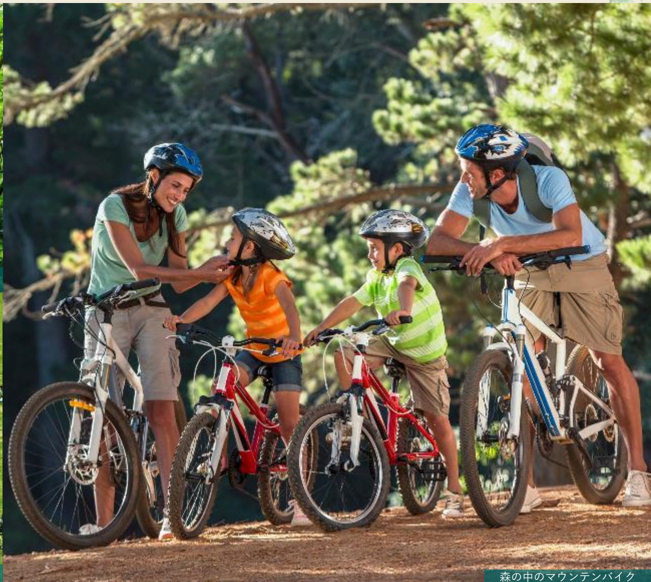
森の中のマウンテンバイク