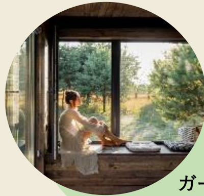
ガーデン付き コテージ