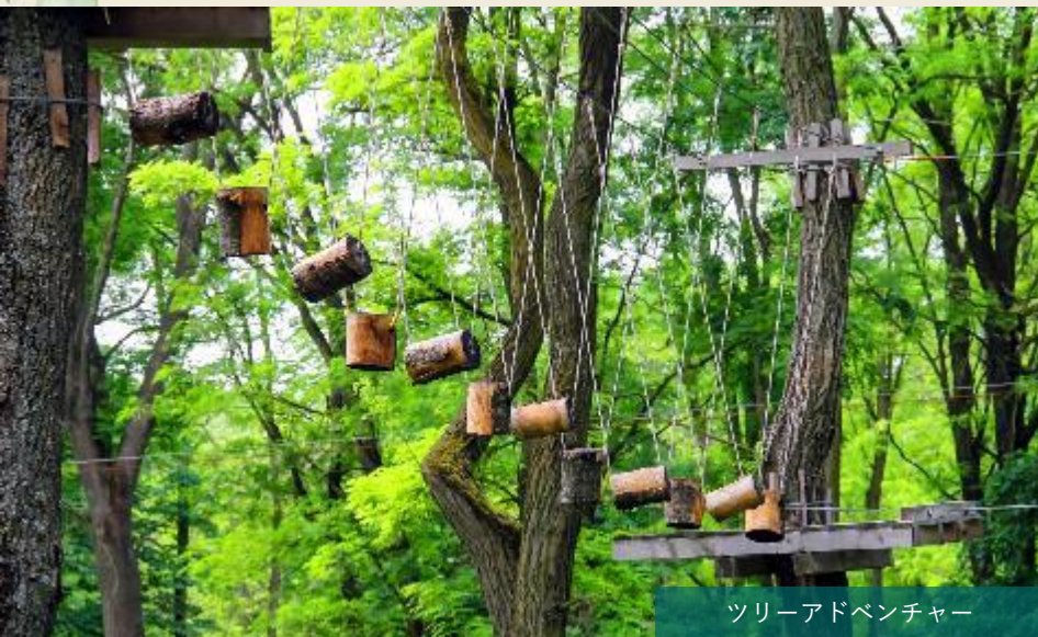
ツリーアドベンチャー

植物園は入場無料で、県民の森との境にはゲートもなく自由な行き来を可能にします。地元のウォーキング団体等と協力し、県民の森のウォーキングと温泉をセットにした企画を定期的で開催します。森の中ではマウンテンバイクやツリーアドベンチャーで思いっきり体を使って森を満喫し、ジップラインは森の中を縦断できます。