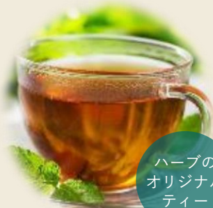
ハーブの オリジナル ティー