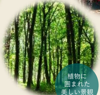
植物に 囲まれた 美しい景観