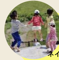
ネイチャーゲーム体験

→既存のコンテンツの他、学びと遊びにエンタテインメントを掛け合わせたメニューを拡充