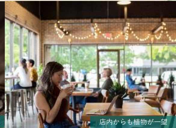
店内からも植物が一望