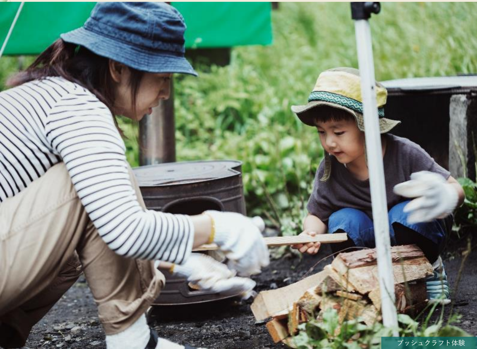
ブッシュクラフト体験

森のカルチャーセンターをワークショップの拠点とし、敷地内で様々な植物に関するワークショップを開催します。これまでの猛禽ふれあいタイムやデイキャンプなども引き続き行いながらも、自然の中にあるモノを活用して、ナイフで木を削り道具を作ったり、焚き火を楽しんだり、滞在するからこそ体験できるメニューなども提供します。植物園ならではの熱帯雨林を再現するパルダリウム作りや、植物図鑑のようなスケッチ体験など大人から小さな子供、インバウンド客も楽しめる、県民の森の恵みや、様々な植物を活かした新しい体験ワークショップを行っていきます。