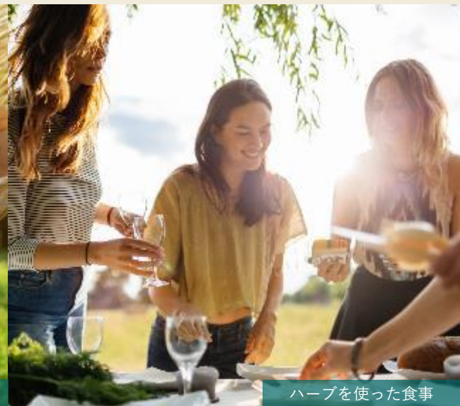
ハーブを使った食事