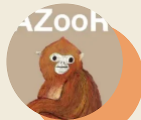
園内専用 SNS・アプリなど ※参考事例：熊本市動植物園