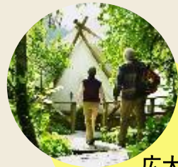
広大な県民の森 トレッキング