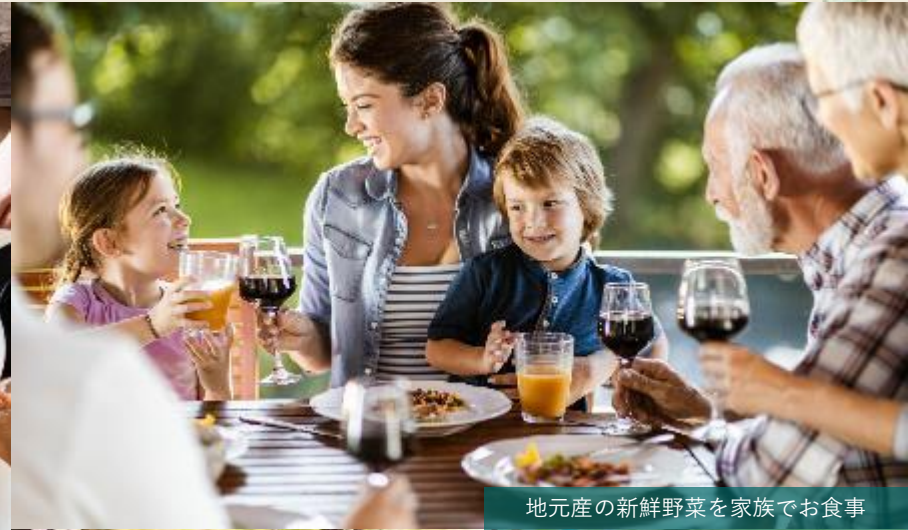
地元産の新鮮野菜を家族でお食事