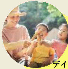
デイキャンプ体験