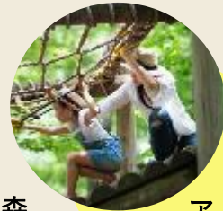
ツリー アドベンチャー