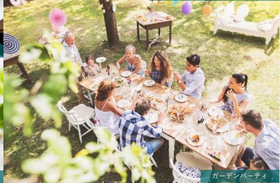
ガーデンパーティー