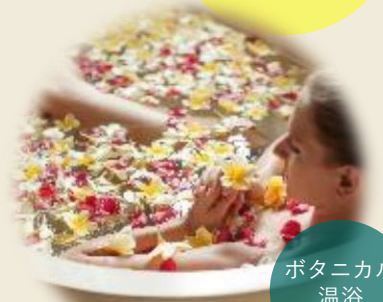
ボタニカル 温浴 サウナ