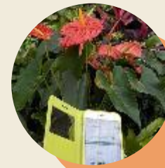
QRコードで 「みんなの趣味の園芸〈植物 図鑑〉」 ※参考事例：春日井市都市緑化植物園 (該当施設関連サイトから引用)