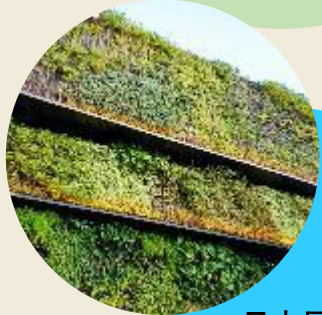
日本最大級の ボタニカルウォール