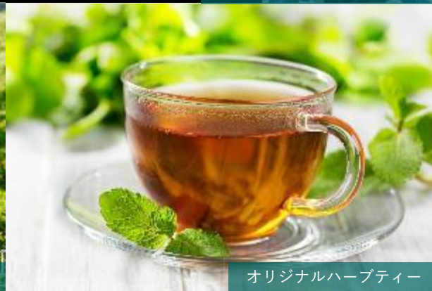
オリジナルハーブティ