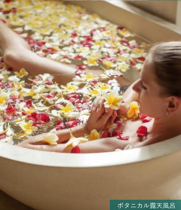
ボタニカル露天風呂