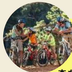
森を駆け抜ける マウンテンバイク