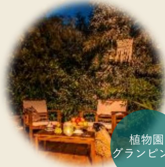
植物園 グランピング