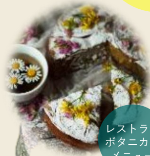
レストラン ボタニカル メニュー