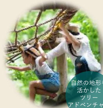
自然の地形を 活かした ツリー アドベンチャー