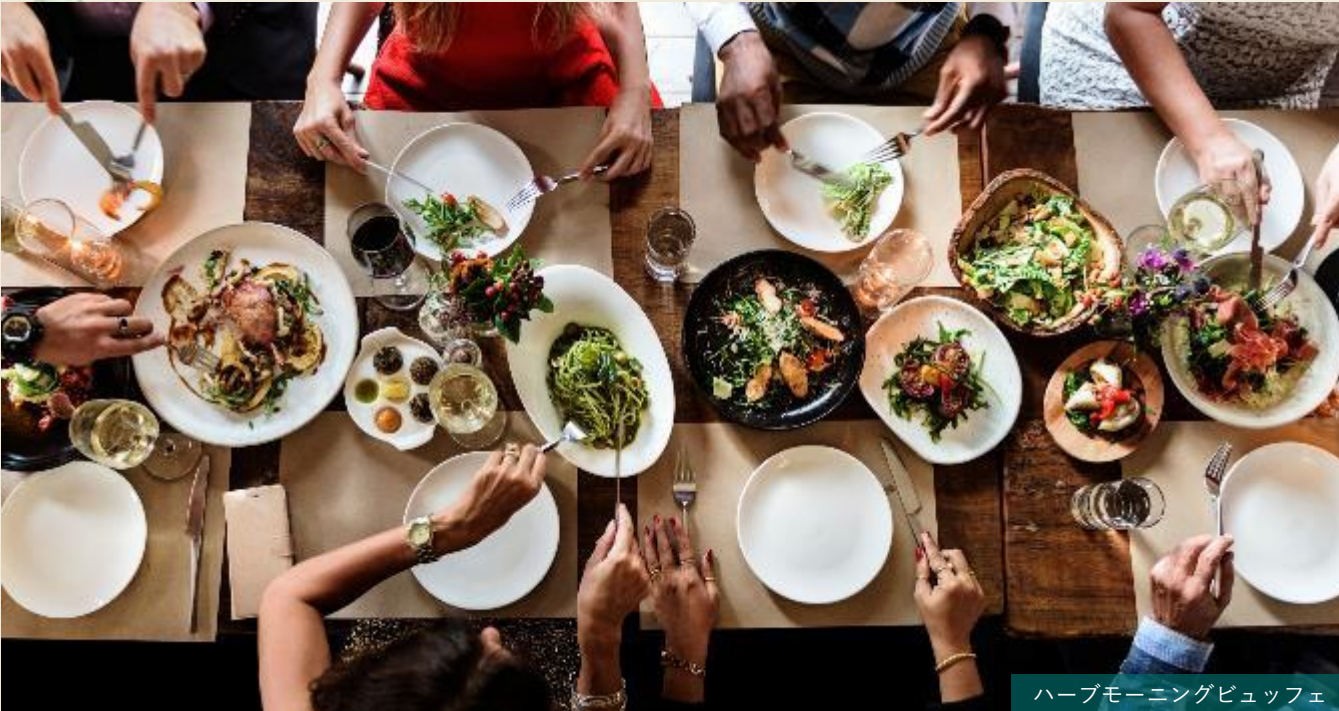
ハーブモーニングビュッフェ

昼下がりには猿島茶・奥久慈茶・古内茶をベースに、ハーブをブレンドしたオリジナルハーブティを作り、ハーブの効いたスコーン等とともにアフタヌーンティが楽しめます。日帰りの利用者の食事ももちろん、宿泊者の朝食会場として、また、ガーデンウェディングの会場や夜の懇親会パーティー会場としての利用を想定しています。