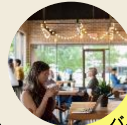
バナラドーム カフェ