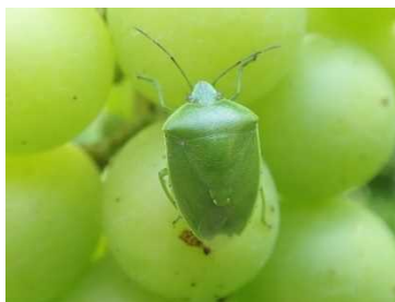
写真2 ツヤアオカメムシ