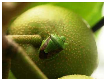
写真1 チャバネアオカメムシ