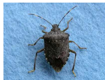
写真3 クサギカメムシ