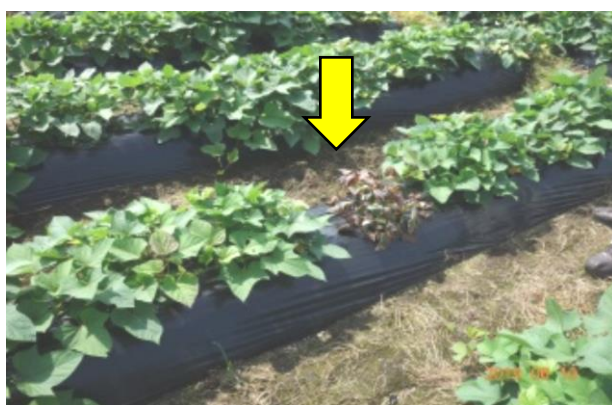
写真4 本圃での生育不良株