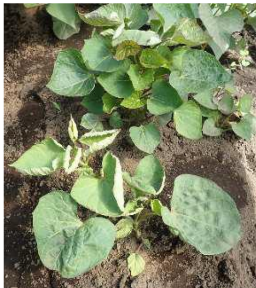
写真2 苗床での葉巻，株の萎縮