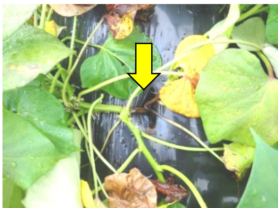
写真3 株元の黒～褐色変症状