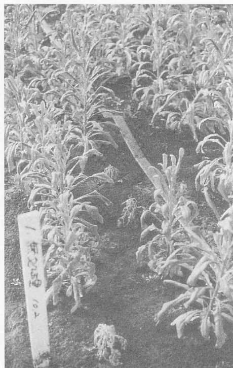
無 処 理