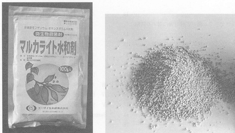
第1図 商品化された非病原性 F. oxysporum 101-2株製剤, マルカライト水和剤 (左: 製剤の包装, 右: 製剤)

なお、本研究は県単バイオテク研究課題「自然生態系の生物相互間の反応の有効利用に関する試験」(1985～1995年) および同「農業生態系における有用微生物および生理活性物質の利活用技術の開発」(1996～2001年) の中で行われたものである。