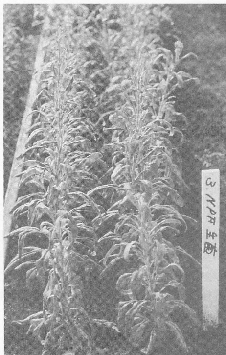
非病原性 F. oxysporum 101-2 株の根部浸漬処理

結果は第4表に示した。無処理区の維管束発病度が43.1であるのに対して、非病原性 F. oxysporum 101-2 株の養土混和処理と根部浸漬処理の併用区では維管束発病度が18.8と最も低く、高い防除価(56.4)を示した。養土混和処理区でも維管束発病度22.8、根部浸漬処理