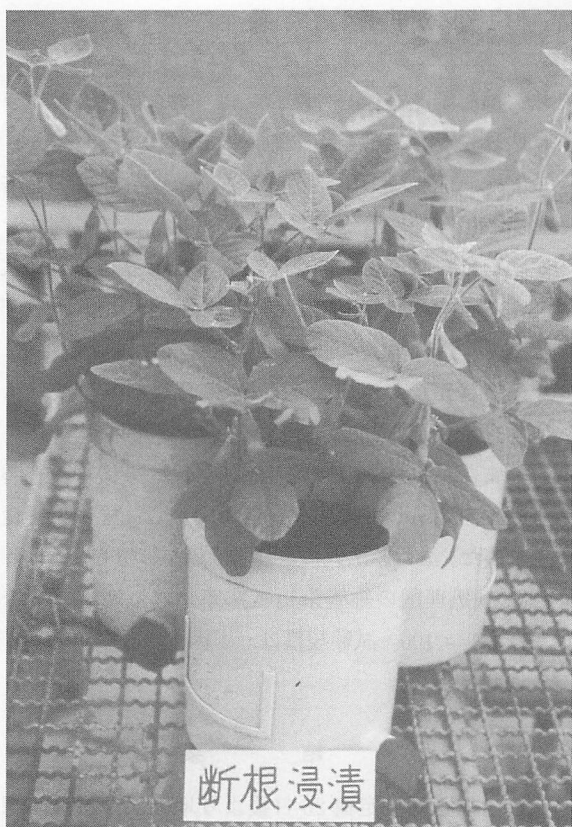
非病原性 F. oxysporum 101-2 株の根部浸漬処理