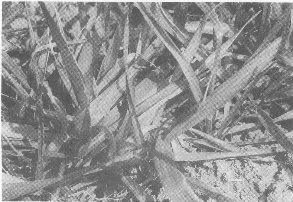
写真4 コムギにおけるコムギ縞萎縮病の病徴