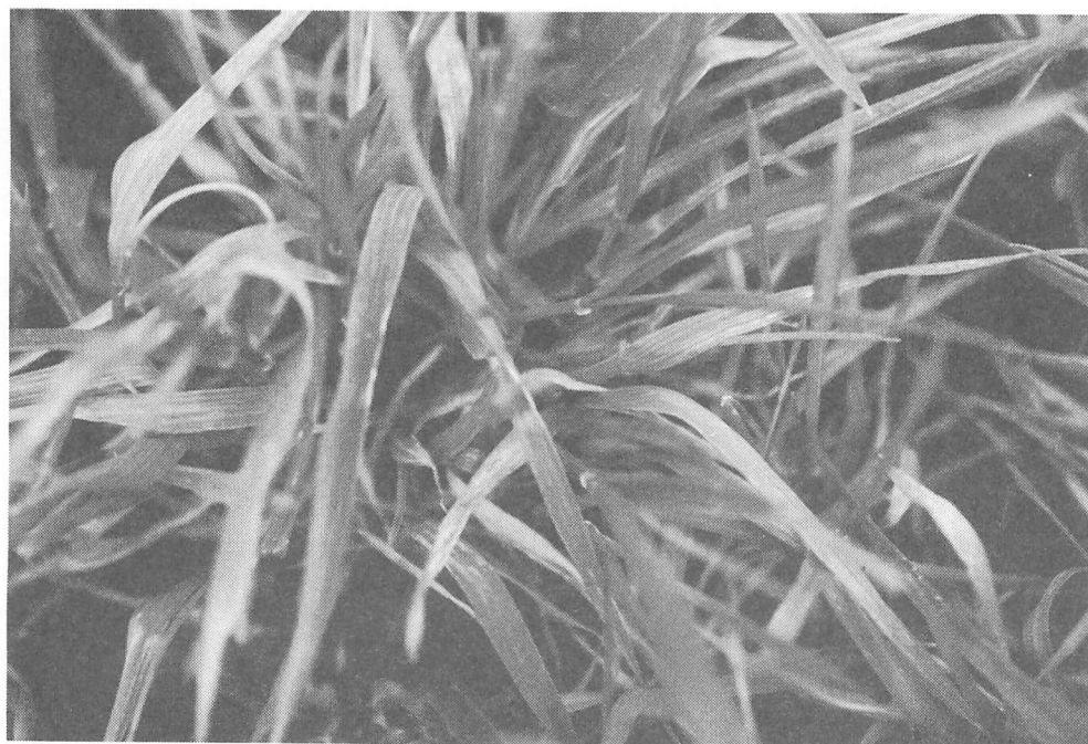
写真6 コムギにおけるムギ類萎縮病の病徴