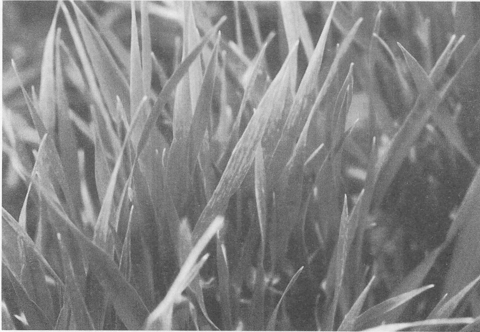
写真10 オオムギ縞萎縮ウイルスⅢ型系統に感染したミサトゴールデンの病徴