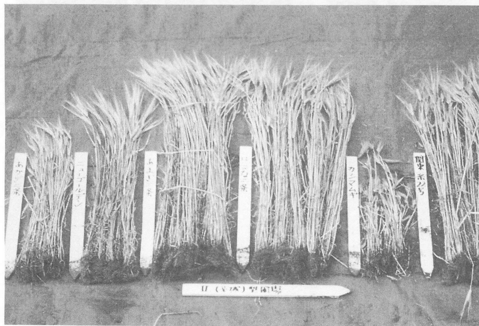
写真9 オオムギ縞萎縮ウイルスⅡ型系統発生圃場におけるオオムギ品種の反応 品種：左から二条オオムギのあかぎ二条，ニューゴールドン，あまぎ二条， はるな二条，六条オオムギのカシマムギ，二条オオムギのミサトゴ ールドン（関東二条22号）