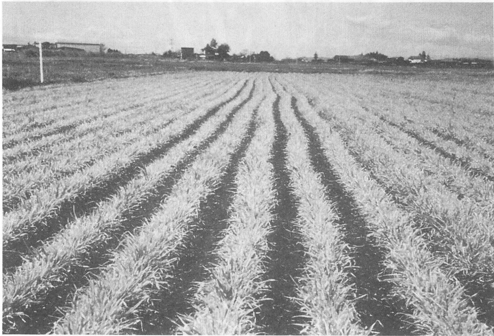
写真1 現地圃場における二条オオムギのオオムギ縮萎病発生状況