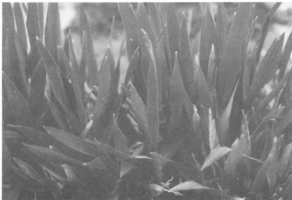
写真5 六条オオムギにおけるムギ類萎縮病の病徴