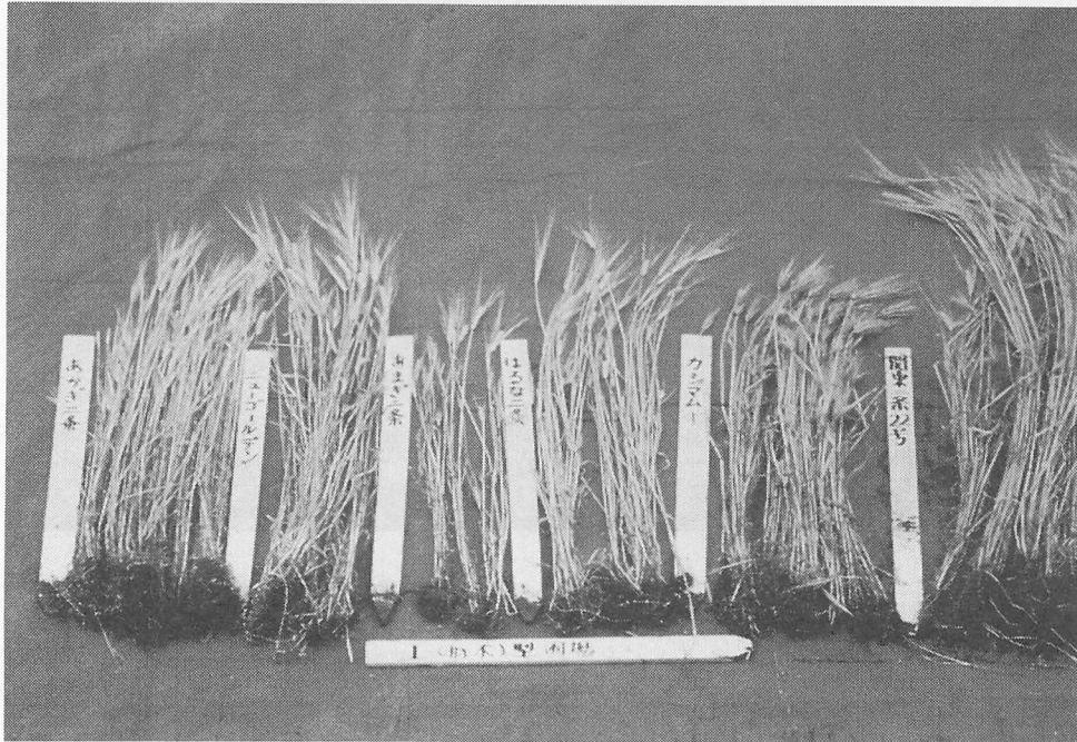
写真7 オオムギ縞萎縮ウイルス I 型系統発生圃場におけるオオムギ品種の反応 品種：左から二条オオムギのあかぎ二条，ニューゴールデン，あまぎ二条， はるな二条，六条オオムギのカシマムギ，二条オオムギのミサトゴ ルデン（関東二条22号）