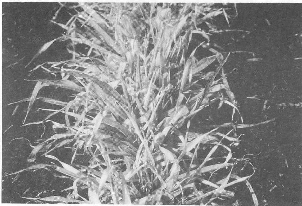
写真2 二条オオムギにおけるオオムギ縮萎病の病徴