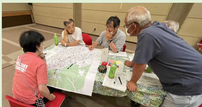
現況地図を使った農地利用の話合ひ

耕作できる農地を、概ね10年後に誰が耕作するのかを話し合ひます。規模拡大意向のある担い手やリタイアを考えている兼業農家等、皆さんの予定を照らし合わせ、集積・集約化も視野に入れます。