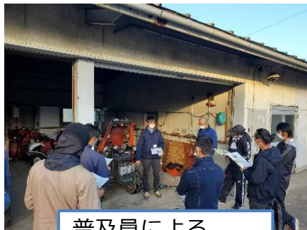
普及員による メンテナンス講習

普及センターでは今後も様々な講座の開催を通して、新規就農者の知識、技術の向上を支援していきます。