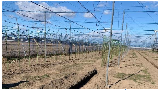
今年度改植したほ場