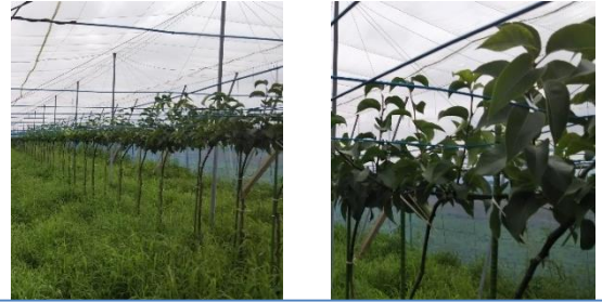
将来的には作業性の良い樹形になる

八千代町では、果樹産地計画を作成し、果樹経営支援対策事業（優良品目・品種への転換、改植・新植）を活用することで、「恵水」を中心としたジョイント栽培に取り組んでいます。計画では、慣行の幸水40aを3年間かけてジョイント栽培の恵水30a、幸水10aに改植する予定です。