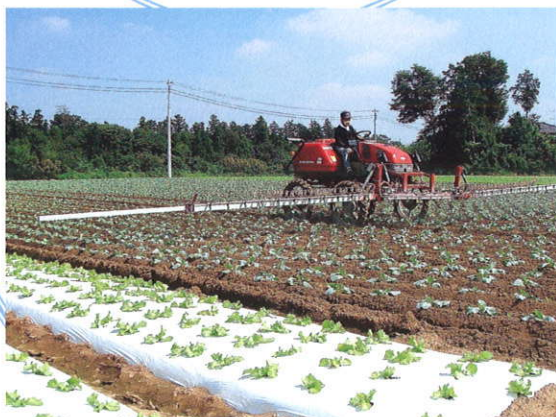
ブームスプレーヤによる薬剤散布