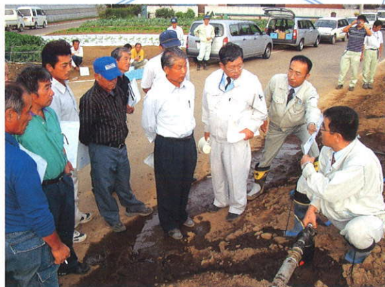
畑かん技術の現地研修会