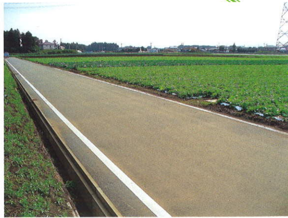
道路・排水路の整備