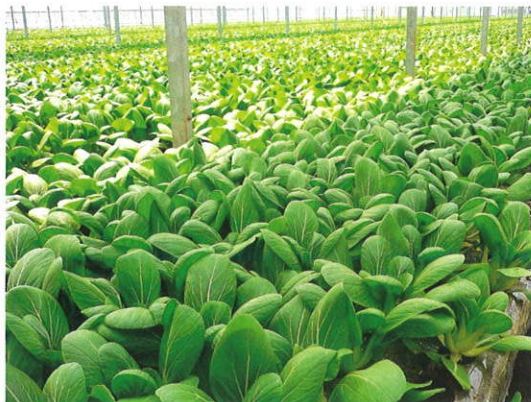
チンゲンサイの施設栽培