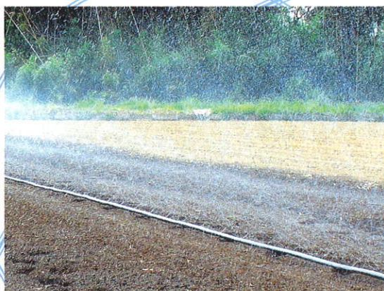
かん水チューブによる散水

若い担い手農家を中心に、畑かん営農研究会が組織され、畑地かんがい技術の向上などに取り組むようになりました。