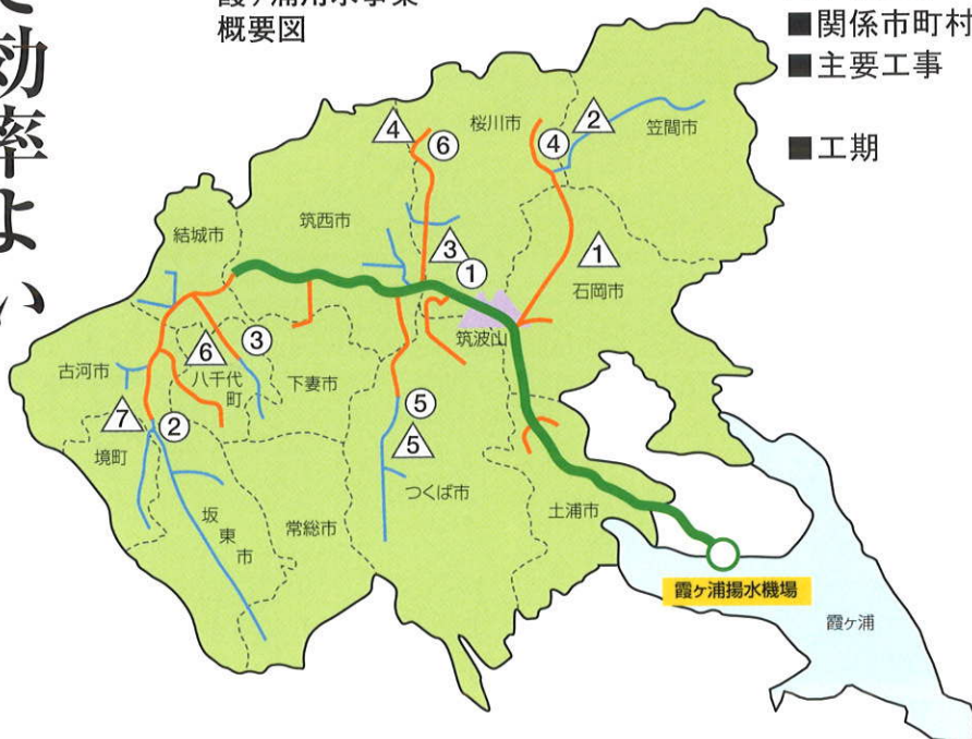
霞ヶ浦用水事業概要図