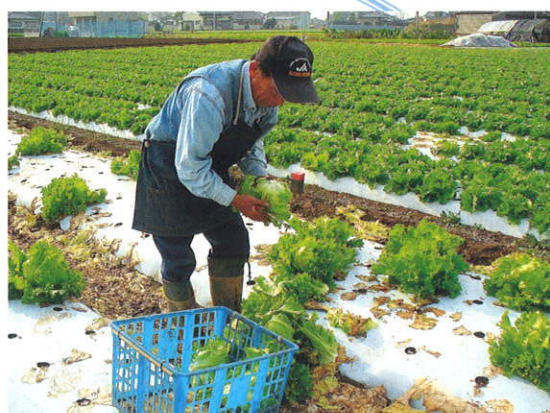
秋レタスの収穫作業