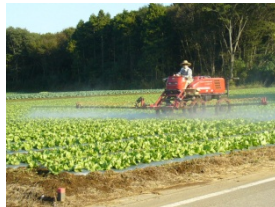
大型機械を用いた収穫