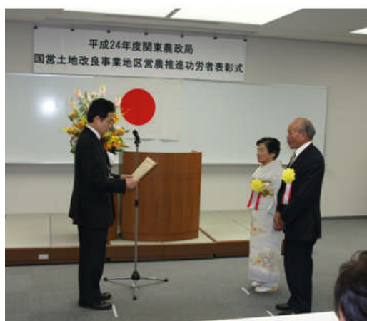
〈平成24年12月14日表彰式の様子〉