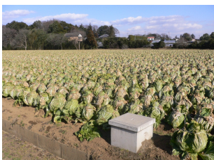
はくさいの栽培風景