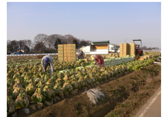
はくさい収穫風景

その結果、現在は契約販売が出荷量の約5割を占めており、市場価格に左右されない安定的な収入を確保しており、「高収益な経営モデル」として地域の模範となっています。