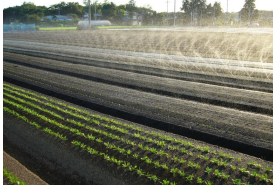
かん水チューブによる畑かん

また、畑地かんがい施設が整備されたことにより、露地・施設野菜における計画的な生産が確立され、栽培作物や生育時期に応じた合理的な水利用に取り組んでいます。