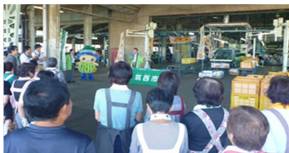
↑ 関城梨果場での 「恵水」初出荷セレモニー