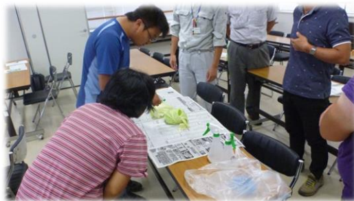
展着剤をかける学園生

学園生からは、「農薬の正しい使い方を知ることができて良かった」、「薬剤散布器具の洗浄を実施する」等、適正使用に向けた前向きな言葉がみられました。