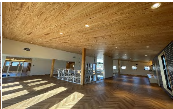
準不燃加工を施した天井板(県産スギ)