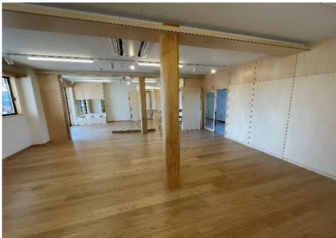
保育室の各所に燃えしろ設計の太い柱(県産ヒノキ)