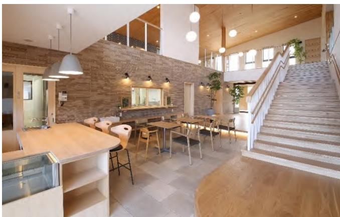
1階のエントランス(カフェスペース)