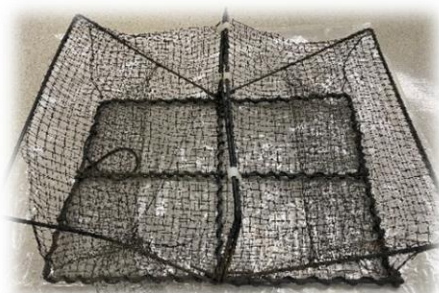
カニかごと設置の様子