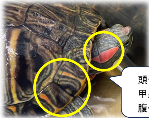
頭部の斑紋 甲羅のしま 腹側の黒い紋