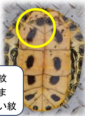
アカミミガメ成体と特徴