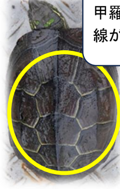
甲羅の3本線が特徴