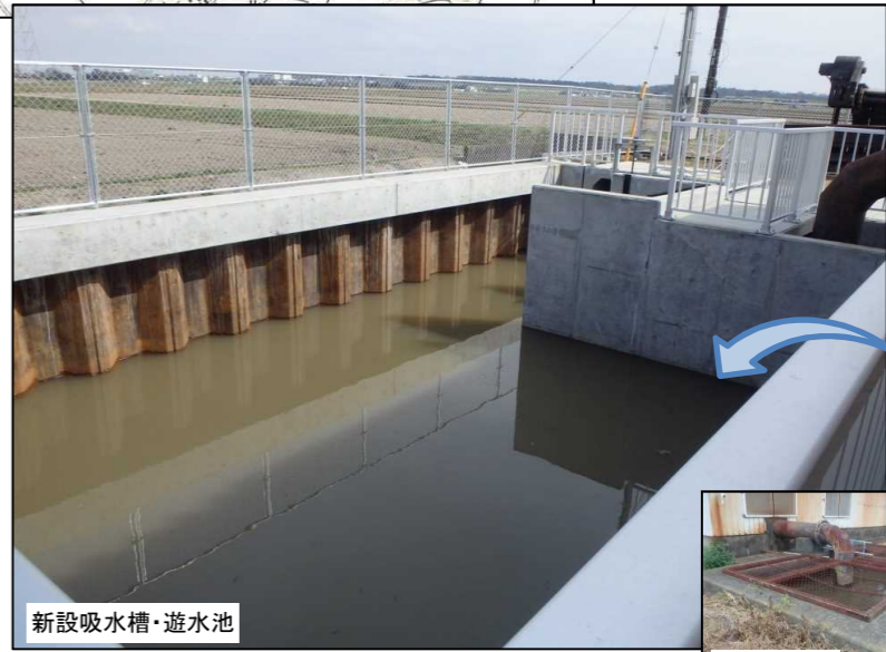
新設吸水槽・遊水池